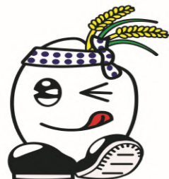
お米キャラクター 茂米(しげべい)